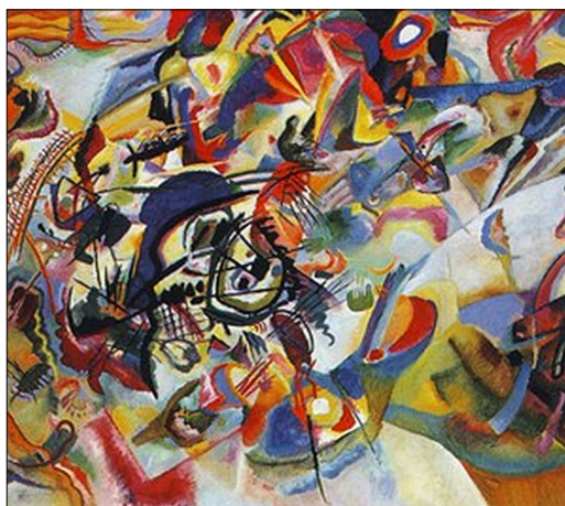
Рис. 1. В. Кандинский. Композиция VI. 1913

При этом музыка использовалась не только в качестве фона: при прослушивании применялись такие методы и приёмы, как сравнение и анализ средств выразительности для того, чтобы студенты могли понять суть музыкального образа, почувствовать настроение, выраженное в звуках. Так, например, при просмотре работ В. Кандинского звучала музыка С. Губайдулиной – каденция из Вариаций на шесть гексахордов «Под знаком Скорпиона» для симфонического оркестра и баяна.