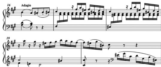
Пример № 5 В. А. Моцарт Соната № 18 D dur KV 576. Ч. 2

Герой аристократического происхождения, репрезентирующий типизированный образ Кавалера, представлен в тематизме моцартовских сонат только в ситуации диалога с Дамой, с позиций партнёра, вовлечённого в любовную коллизию. В операх Моцарта, предворяющих эти сонаты, данному амплу соответствуют граф Бельфьоре («Мнимая садовница»), добывающий руки маркизы Виоланты (Сандрины), и дворянин Бельмонте («Похищение из сераля»), воссоединяющийся с невестой Констанцей. Музыкальную характеристику названных персонажей объединяют комплексы устойчивых героических и лирико-галантных интонаций, в высказываниях Бельфьоре обусловленные его склонностью к самолюбанию, а в номерах, исполняемых Бельмонте, передающие юношескую порывистость и сентиментальность.