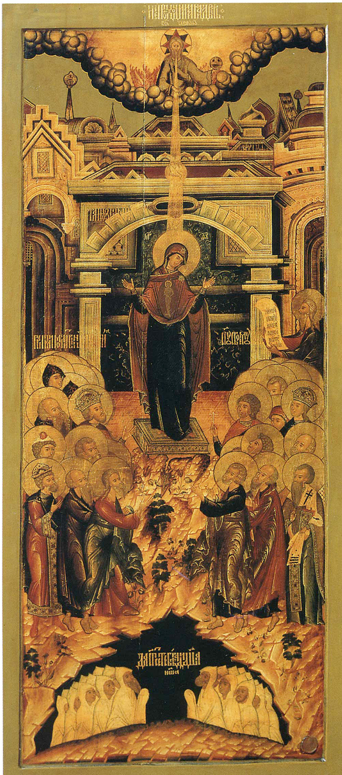
Ил. 2. Икона «Непроходимая Дверь». Вторая половина XVII века. Государственный Русский Музей, Санкт-Петербург, Россия Il. 2. Icon The Impassable Door Second Half of the 17th Century. State Russian Museum, St. Petersburg, Russia

Представленная на ил. 2 икона имеет больше уровней. Вверху на облаке восседает седовласый Бог Отец. Его уста выпускают дыхание, которое показано зрителям в виде белокрылого голубя. Это дыхание есть Дух Святой, спускающийся на Деву Марию. Богородица – не только Оранта, но также Знамение с младенцем Христом на груди, – «стоит на среднем ярусе в полный рост, её руки вознесены в пламенной мольбе. Под ногами расположено возвышение, незримо указующее на то, что Мария по своим духовным и душевным качествам выше мирских людей. Вокруг Богоматери стоят праведники, святые, их лики обращены к Ней, а руки распростёрты в молитвенных жестах». На нижнем ярусе в белых пеленах на чёрном фоне «показаны люди, находящиеся за гранью земного бытия. Они возносят свои мольбы Богородительнице, дабы Она родила Спасителя Мира, который выведет мёртвых из ада и введёт мир в райские обители» 13 . Архитектура храма показана многослойно. Цветовая герменевтика здесь имеет традиционное решение.