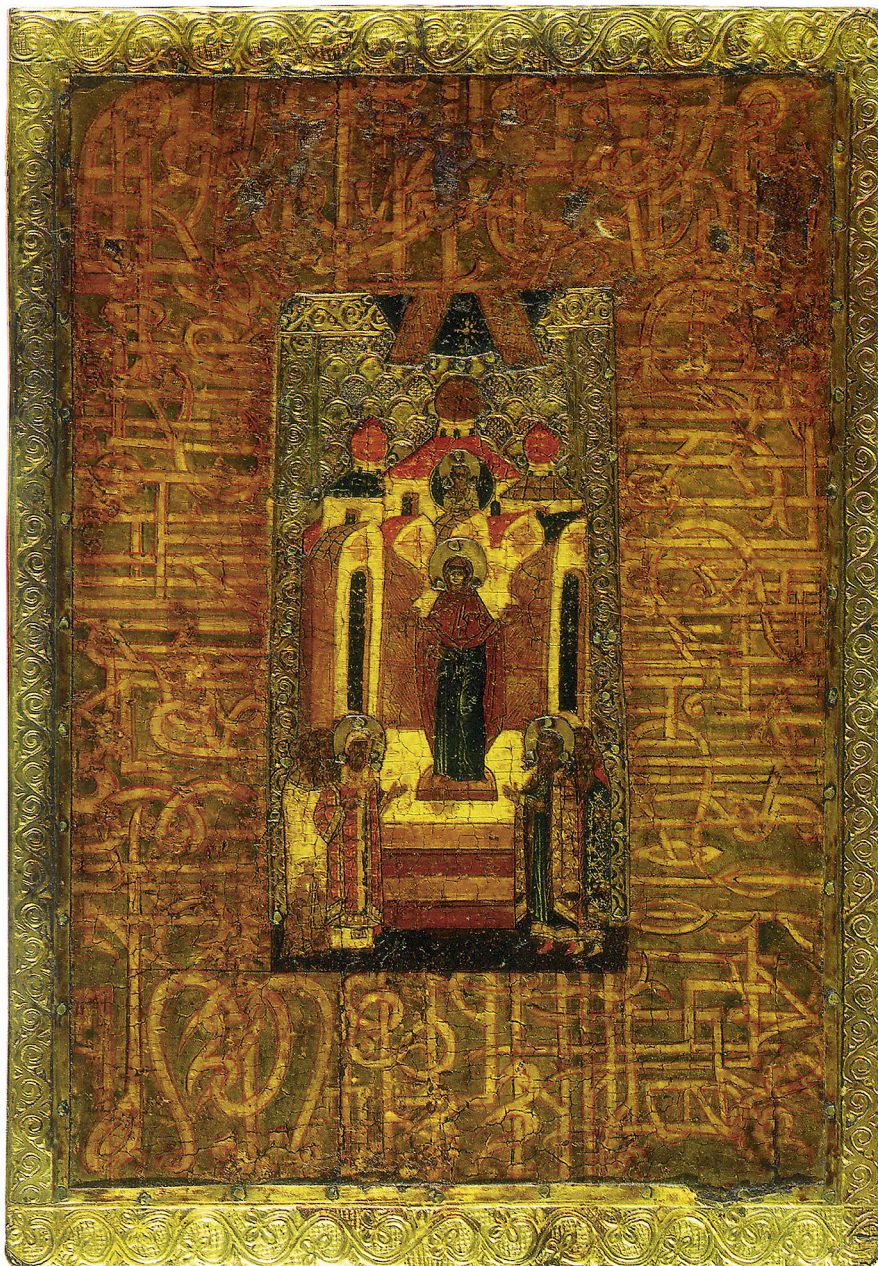
Ил. 1. Икона «Богоматерь Дверь Небесная». Конец XVI века, Псков [?]. Дерево, темпера, серебро; тиснение, золочение. 32×22 (оклад). Государственная Третьяковская галерея, Москва, Россия