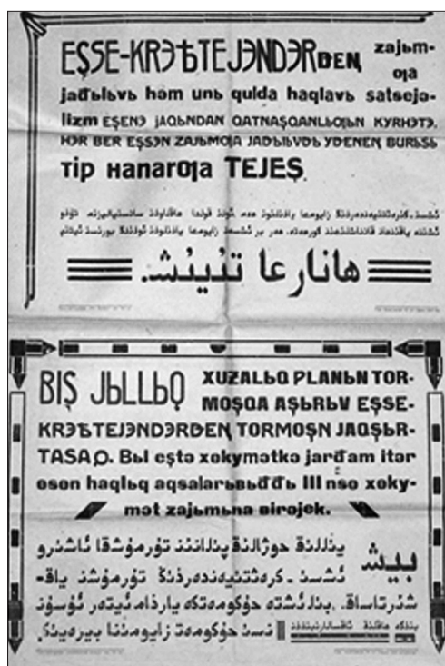
Рис. 8 в. Театральная афиша показательного спектакля техникума искусств, 1930. Одновременно представлены арабский шрифт, латиница и кириллица