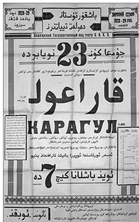
Рис. 8 г. Театральная афиша Башкирского государственного театра, 1928. Одновременно представлены арабский шрифт и кириллица