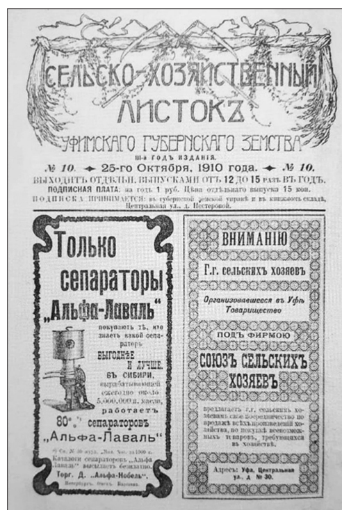
Рис. 1 б. Сельскохозяйственный листок Уфимского губернского земства. 1910

Появление модерна в искусстве афиши в Башкирии было органичным, поскольку в отличие от европейской культуры, открывшей для себя восточное искусство в конце XIX века, мы уже находились на стыке Европы и Азии. Шрифтовые композиции отличались декоративностью через ритмичное чередование структур и линий, орнаментальностью (рис. 1 а). Отличительной чертой провинциальной полиграфической продукции в этот период является использование на одном формате большого количества различных шрифтов. Это позволяло зрительно разнообразить текст и расставлять акценты (рис.1 б).