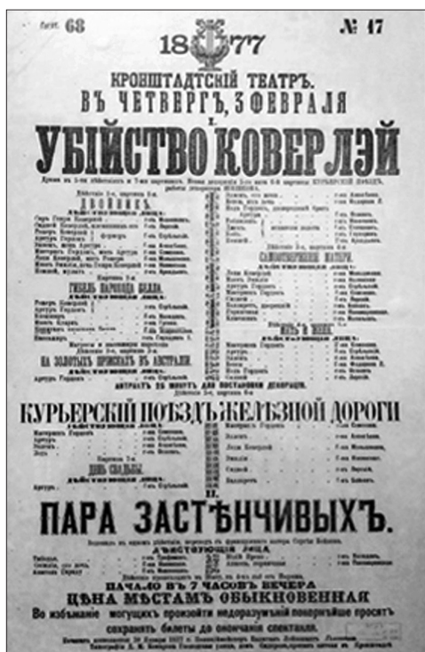
Рис. 4 а. Театральная афиша XIX века. Кронштадтский театр

стилем модерн (рис. 7). Это обусловлено в первую очередь национальными традициями республики и орнаментальным