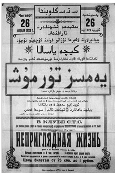
Рис. 8 а. Театральная афиша, 1928. Одновременно представлены арабский шрифт и кириллица