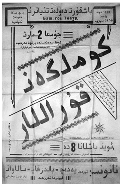
Рис. 4 б. Театральная афиша Башкирского государственного театра, 1928